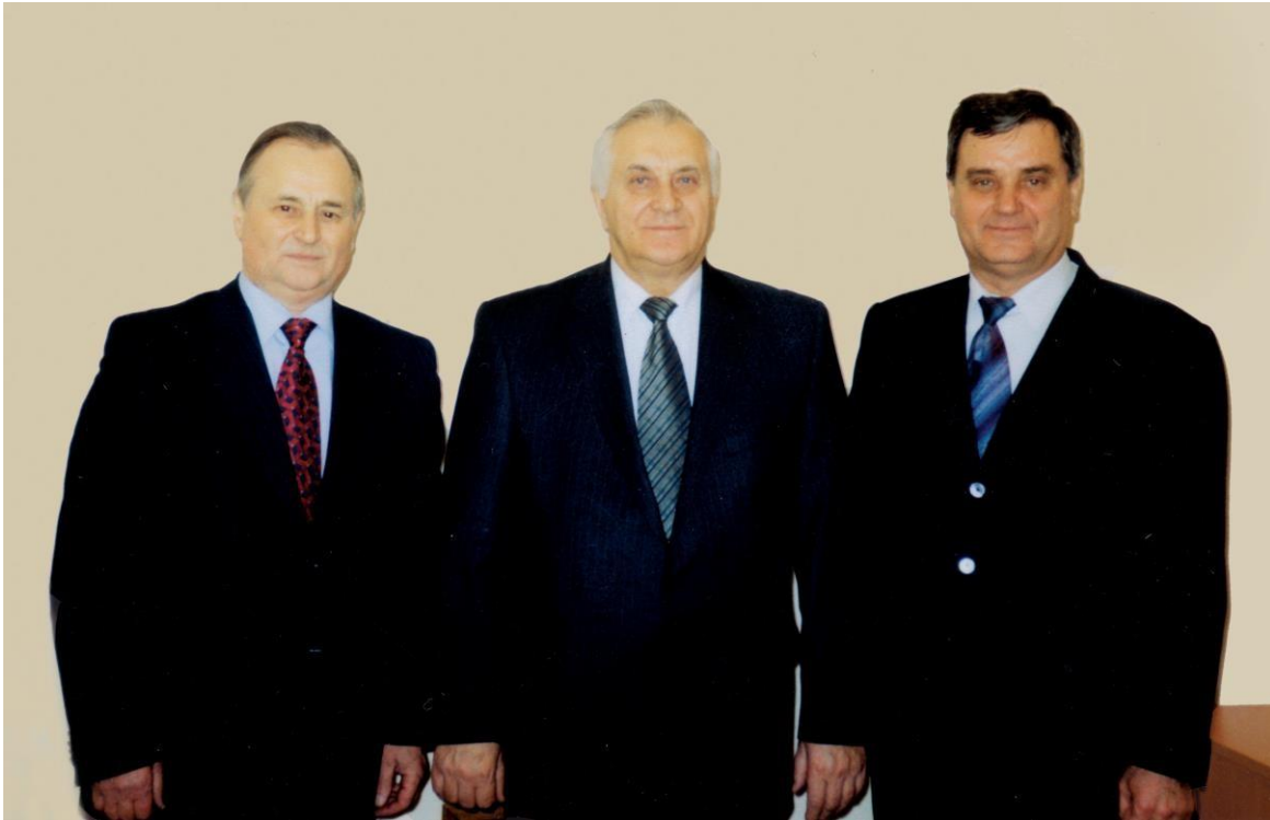
Голови Комітету (справа — наліво) II, III, IV скликань Верховної Ради України: Шейко П. В. (II скл.), Матвєєв В. Г. (IV скл.), Омеліч В. С. (III скл.)

14 травня 1998 року Постановою Верховної Ради України «Про затвердження переліку комітетів Верховної Ради України чотирнадцятого скликання » утворено Комітет з питань Регламенту, депутатської етики та організації роботи Верховної Ради України. Головою Комітету було обрано Омеліча Віктора Семеновича , який очолював Комітет з 10 липня 1998 року по 14 травня 2002 року. В цей період Комітетом підготовлено до розгляду та прийнято Верховною Радою України Закон «Про статус народного депутата України», зміни та доповнення до Регламенту Верховної Ради України.