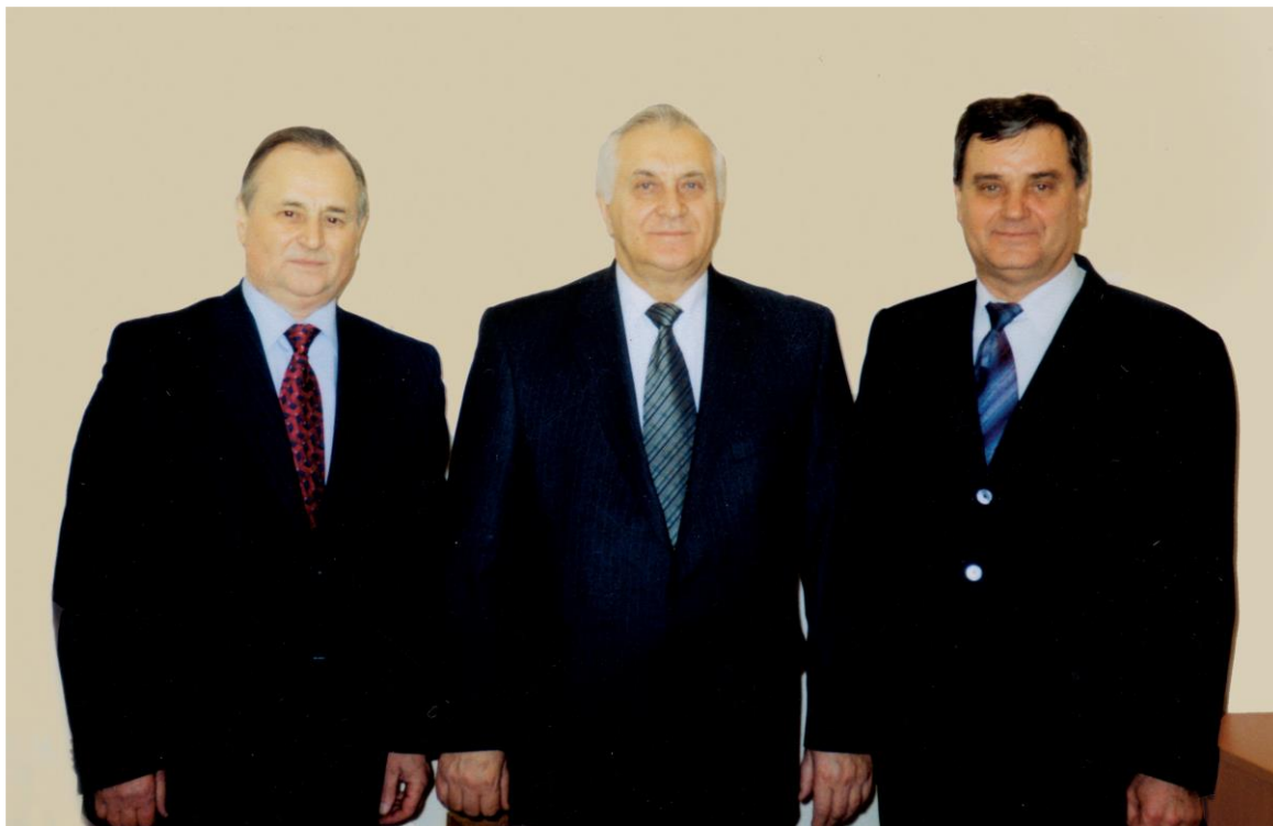
Голови Комітету (справа — наліво) II, III, IV скликань Верховної Ради України: Шейко П. В. (II скл.), Матвєєв В. Г. (IV скл.), Омеліч В. С. (III скл.)

13 травня 1998 року Постановою Верховної Ради України «Про перелік комітетів Верховної Ради України чотирнадцятого скликання » утворено Комітет з питань Регламенту, депутатської етики та організації роботи Верховної Ради України. Головою Комітету було обрано Омеліча Віктора Семеновича , який очолював Комітет з 10 липня 1998 року по 14 травня 2002 року. В цей період Комітетом підготовлено до розгляду та прийнято Верховною Радою України Закон «Про статус народного депутата України», зміни та доповнення до Регламенту Верховної Ради України.