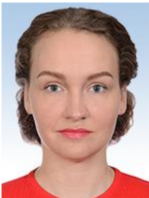
Приходько Наталія Ігорівна

Член Комітету Представник депутатської фракції Політичної партії "СЛУГА НАРОДУ"